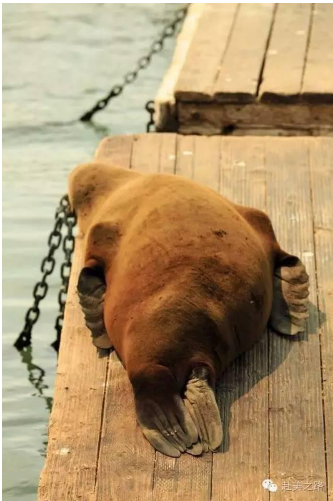
有安心晒太阳的慵懒的海豹