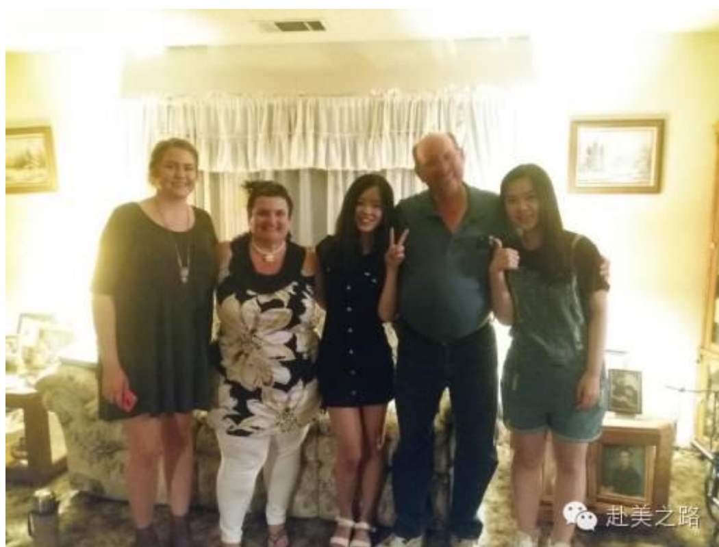
最重要的就是 结识了热情的美爸美妈