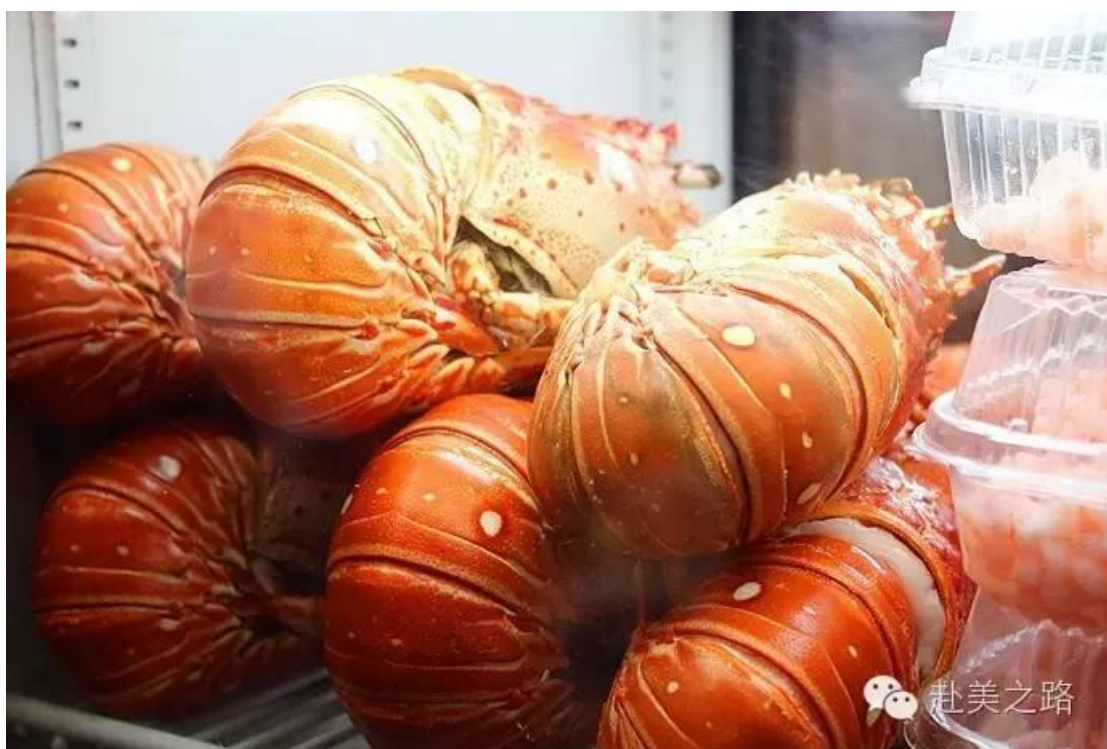
物美价廉的上好的海鲜