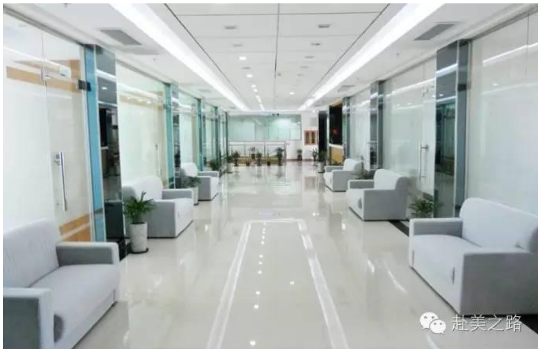
你没有看错 这也是美国医院