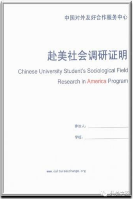
赴美社会调研证明