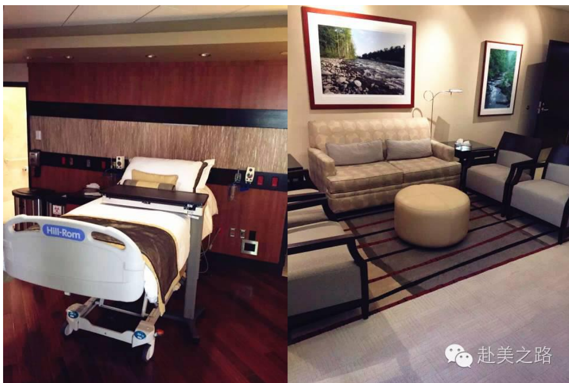
这依然是美国医院