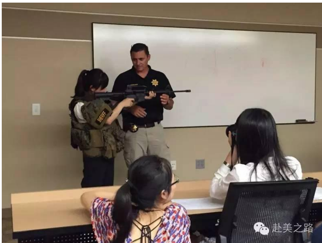
关于调研场地，我们会去到 警察局